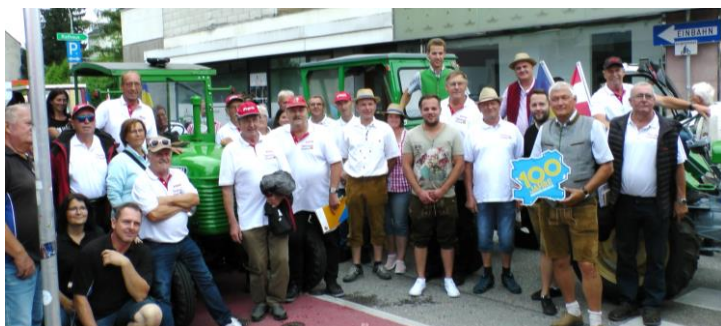
Die Marktgemeinde Strengberg bedankt sich recht herzlich bei allen Teilnehmern!

Am 01. Jänner 1922 trat das Trennungsgesetz, das Niederösterreich vollständig von Wien löste, in Kraft. Das 100-jährige Jubiläum dieser Trennung wurde dieses Jahr mit dreitägigen Festen in den jeweiligen Bezirken gefeiert. Auch Amstetten hat sich bestens auf das Ereignis vorbereitet. Am Samstagnachmittag wurden die Gemeinden des Bezirks in den Vordergrund gestellt. Darunter hat sich auch Strengberg beim Programm beteiligt. Zahlreiche StrengbergerInnen haben sich am 25.06.2022 am Schulplatz in Strengberg mit ihren Oldtimer-Traktoren versammelt, um gemeinsam zum Bezirksfest zu fahren. Dort konnten die Raritäten bestaunt werden. Darunter war auch der 2.800 PS starke „Morpheus“, der schon mehrmals den Titel des Staatsmeisters im Tractor-Pulling geholt hat.